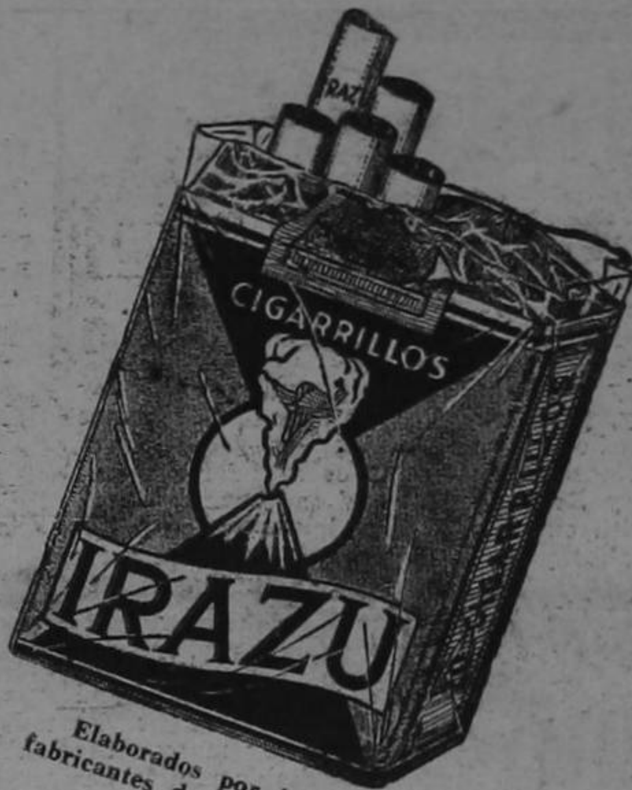
Elaborados por los fabricantes de LIBERTY